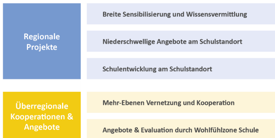
Abb. 1 Überblick Maßnahmen Wohlfühlzone Schule